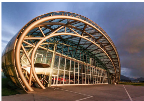
гаражей, боксов, ангаров