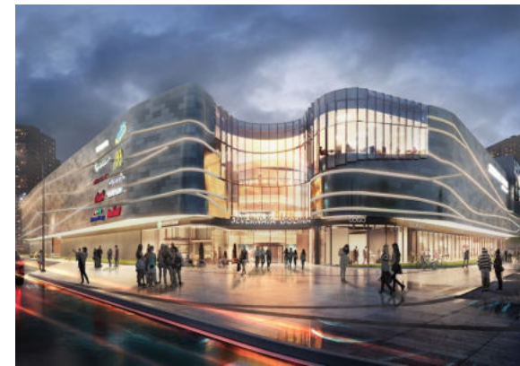
магазинов и торгово- развлекательных центров