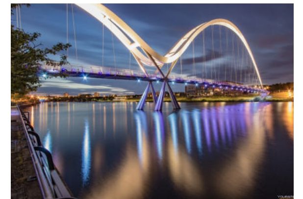
мостов и виадуков