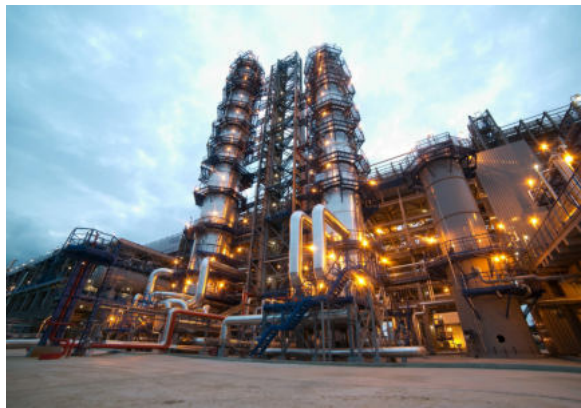
предприятий, промышленных цехов и площадок